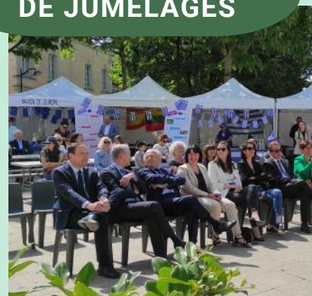
DISCOURS DES ÉLUS