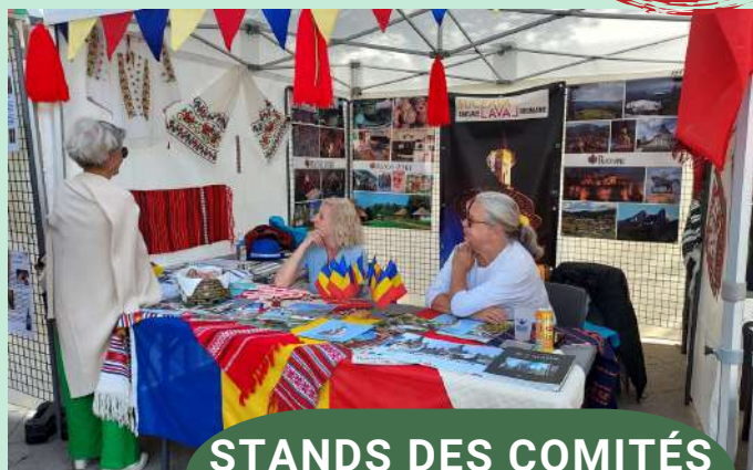
STANDS DES COMITÉS DE JUMELAGES