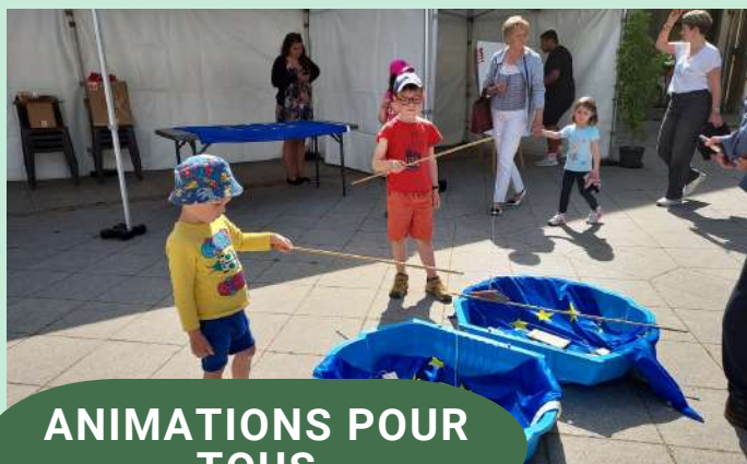
ANIMATIONS POUR TOUS